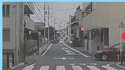
▲ 該当箇所周辺を画像で確認可能。

登録を行なうと、道路標識のほかポールやブロック壁などもわかりやすくイラストで表示されます。